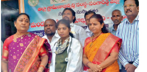
స్వయంసహాయక గ్రూప్ మహిళలకు రక్త పరీక్షలు చేస్తున్న దృశ్యం