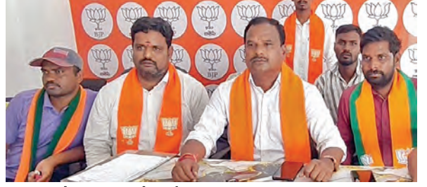
విలేజరుల సమావేశంలో మాట్లాడుతున్న బిజినెస్ నాయకులు

-రూ.5కోట్ల అదాయానికి గండి... క్రిమినల్ కేసులు పెట్టాలని బిజినెస్ డిమాండ్