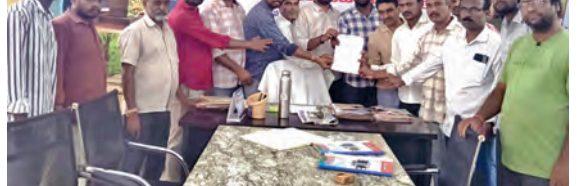
తహసీల్దార్ కు వినతిపత్రం అందిస్తున్న అసోసియేషన్ సభ్యులు