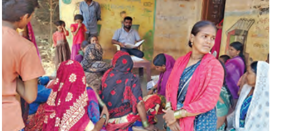
అంగన్వాడీ కేంద్రాన్ని పరిశీలించిన సర్పంచ్