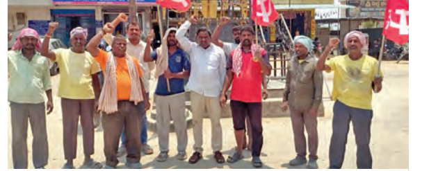
వెల్మిలలో సిపిఎం అధ్యక్షులతో ధర్మా