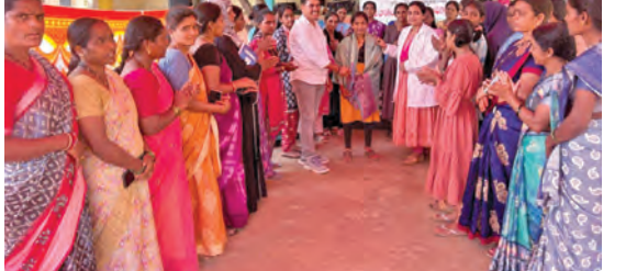
వికాసం వేసవి శిక్షణ కార్యక్రమాలు ప్రారంభిస్తున్న దృశ్యం