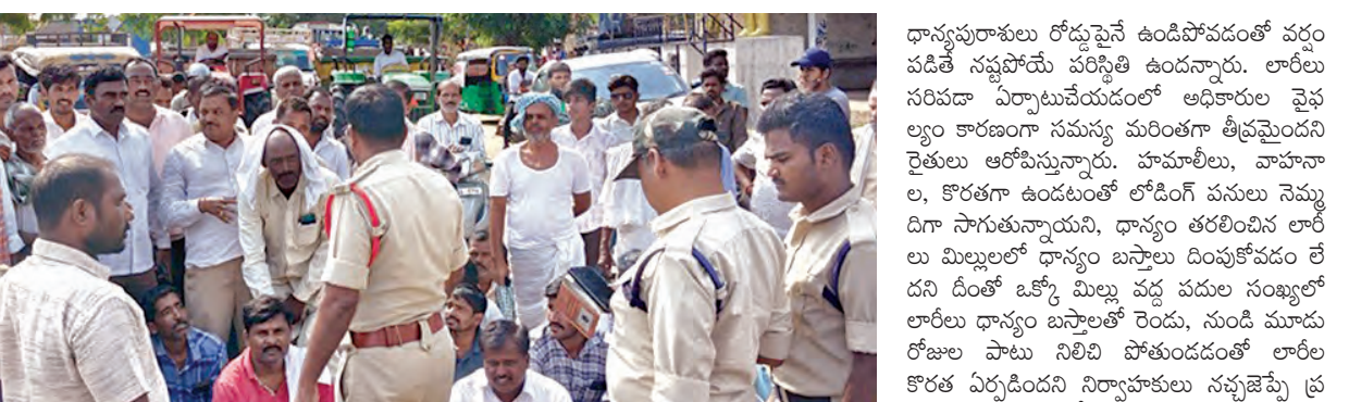
నిరసన చేపడుతున్న రైతులతో మాట్లాడుతున్న పోలీసులు