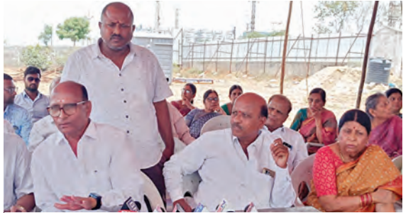
విలేజరులతో మాట్లాడుతున్న అసోసియేషన్ సభ్యులు దృశ్యం

-కొల్లూరు లక్ష్మీవరం ఫ్లాట్స్ ఓసర్స్ అసోసియేషన్ సభ్యులు